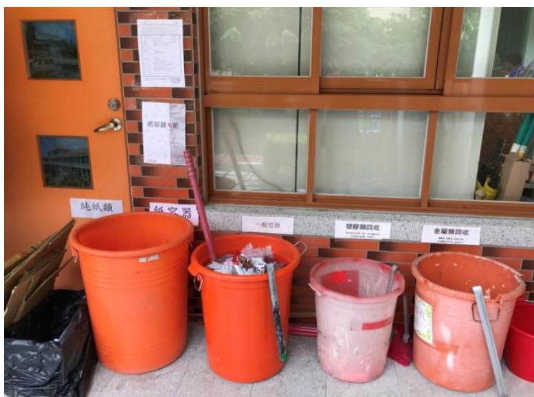
各教室及辦公室外均設置設置回收桶，落實資源回收分類