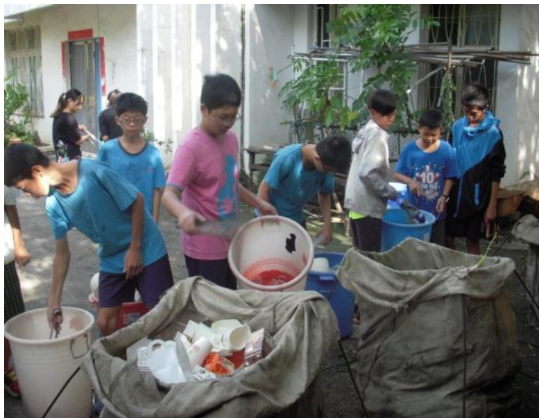
環保小志工於打掃時間進行分類回收工作，確保資源回收分類正確